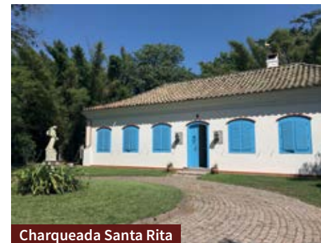
Charqueada Santa Rita

Ao chegar na Charqueada Boa Vista o imenso jardim chama a atenção. O empreendimento