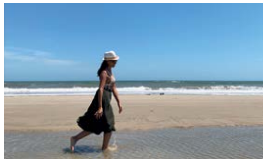
Praia do Hermenegildo