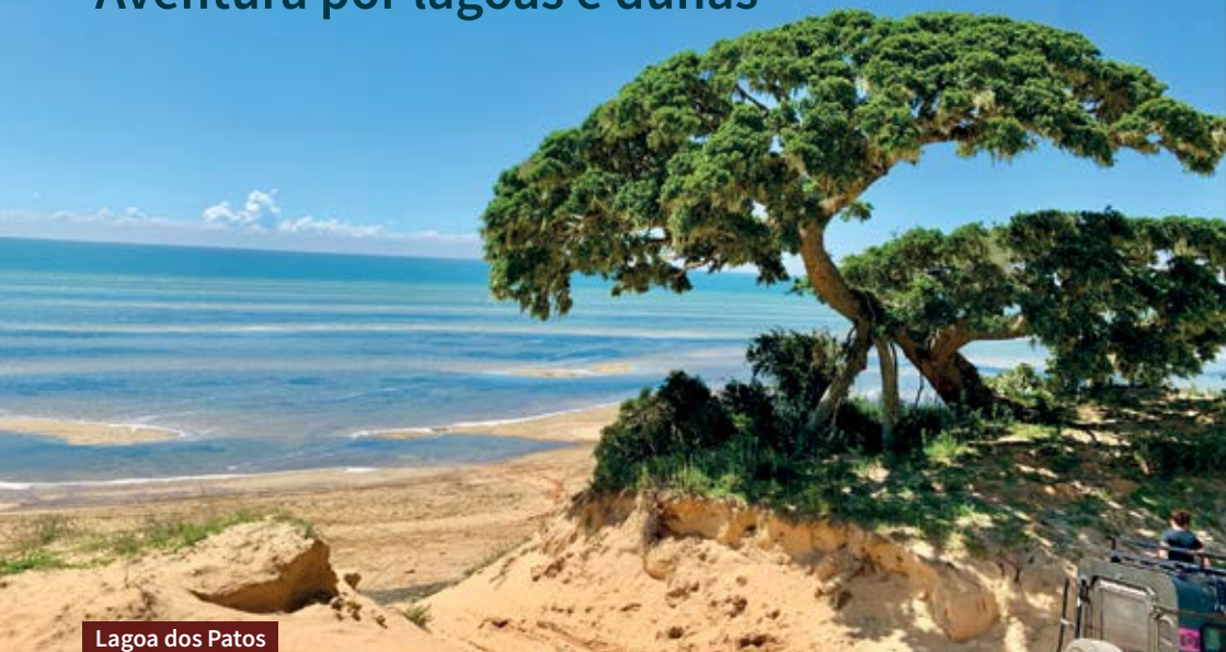
Lagoa dos Patos

D estino para quem busca contato com a natureza, Tavares é uma verdadeira joia da Costa Doce Gaúcha. A 230km de Porto Alegre, a cidade fica dentro do Parque Nacional da Lagoa do Peixe, o que faz da viagem uma experiência incrível e diferente.