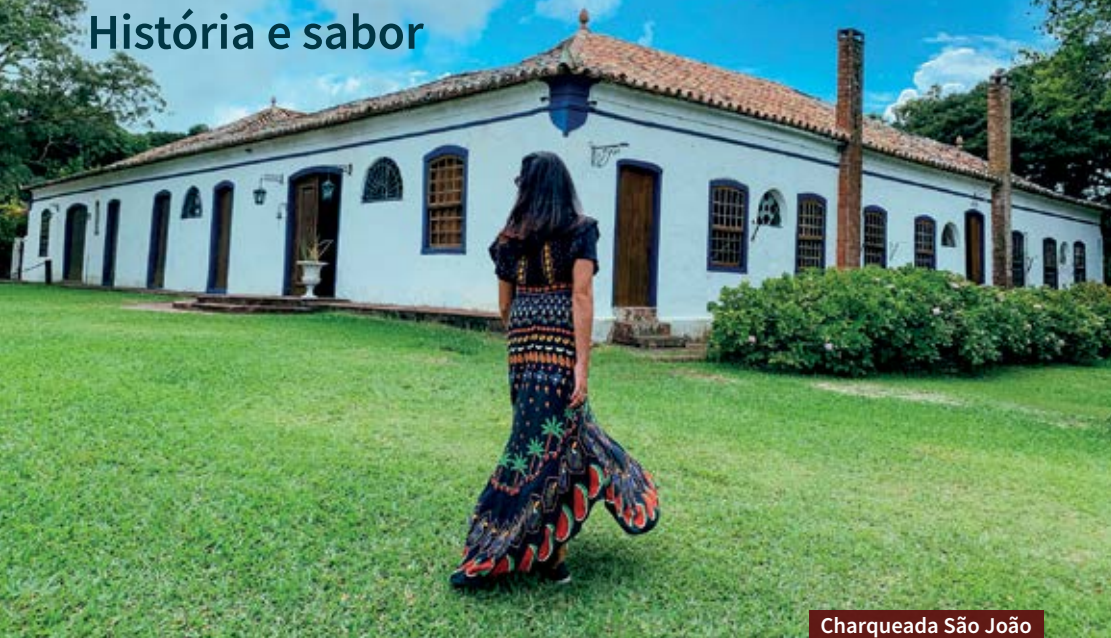
Charqueada São João

P ara quem gosta de destinos completos, Pelotas merece alguns dias de roteiro. Um dos pontos altos está na parte histórica da cidade, que viveu uma época áurea com a indústria do charque, principal economia no século 19. Por conta disso, as charqueadas são um dos principais atrativos e preservam tradições.