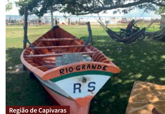
Região de Capivaras

Há duas grutas no interior. A gruta de Nossa Senhora de Fátima está em uma região chamada Capivaras. É rodeada por bambus e tem