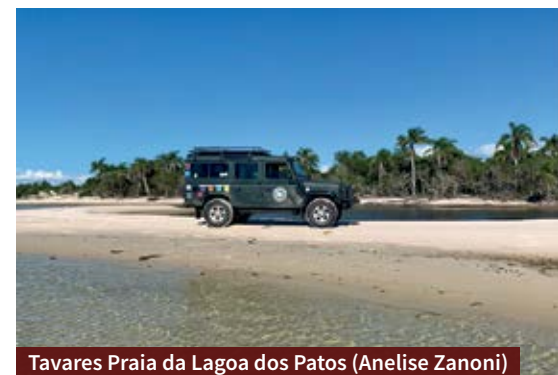
Tavares Praia da Lagoa dos Patos (Anelise Zanoni)

Informações: Agência Jardineira Guaíba/Duo Viagens. Telefone: (51) 3219-4450 e (51) 98578-2443. Veja também o Instagram e Facebook