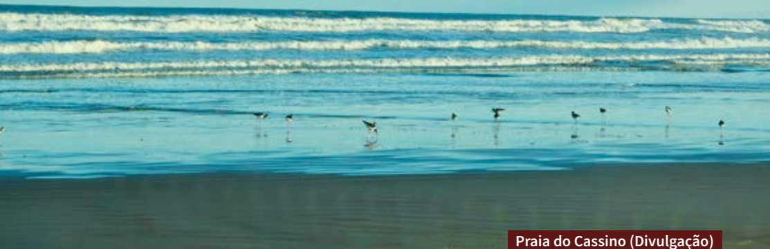
Praia do Cassino

No extremo sul do Rio Grande do Sul, a cidade de Rio Grande é um importante reduto para a economia gaúcha devido à área portuária. No entanto, o setor turístico também tem muita força, e a natureza e a história são protagonistas. A praia do Cassino, a Capilha e o Taim são exemplos de lugares lindos do roteiro, que merece ao menos dois dias.