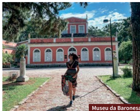
Museu da Baronesa

Os doces de Pelotas fazem parte da história e da tradição da cidade que tem forte influência portuguesa. Por isso, é quase obrigatório experimentar algum dos diversos doces pelotenses. Entre os principais estão os docinhos à base de ovos, como quindim e ninhos. Indicamos alguns lugares para você experimentar: Confeitaria Berola , Doçaria Monalu , Imperatriz Doces Finos e Trufas Meuy .