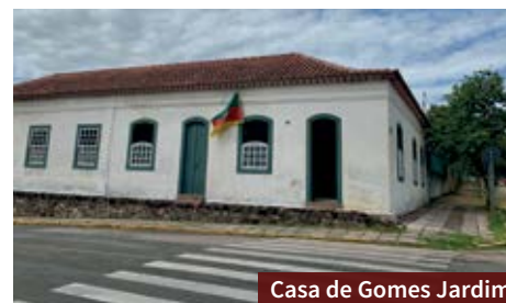
Casa de Gomes Jardim