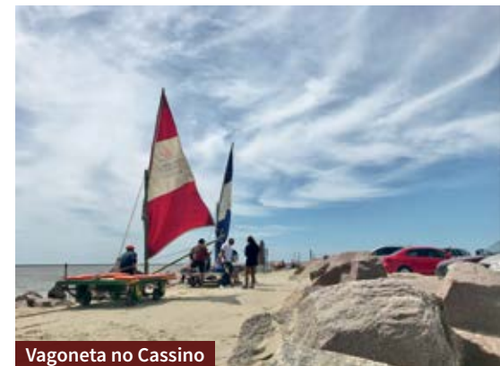
Vagoneta no Cassino

* A visita deve ser agendada pelo e-mail mineiatur@gmail.com ou pelo número (53) 99169-9735, com a Mineia Turismo.