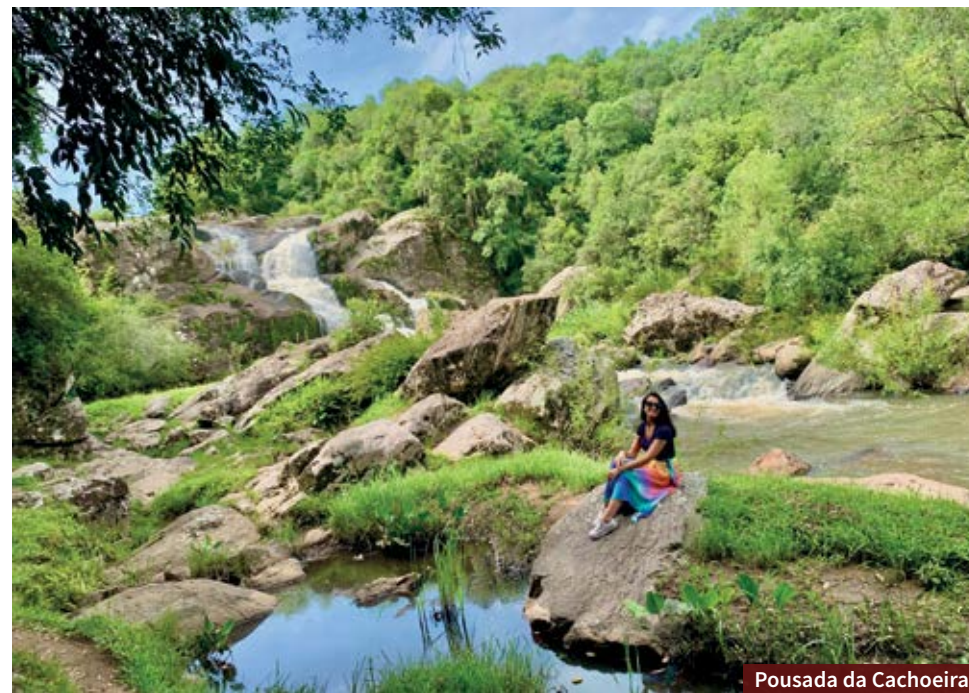
Pousada da Cachoeira

Morro Redondo é um daqueles lugares imersos na natureza. Por isso, indicamos que você leve roupas bem confortáveis e repelente nos passeios. Também não tenha pressa, porque é um destino para você contemplar e se conectar!