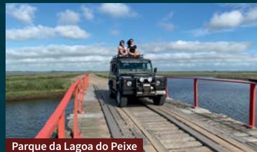
Parque da Lagoa do Peixe

Tavares é um destino que une aventura e muita natureza. Por isso, para alguns passeios você vai precisar de veículo 4x4, devido ao solo arenoso e aos trajetos no meio da água. Caso você não tenha ou não consiga alugar, a agência receptiva faz os passeios.