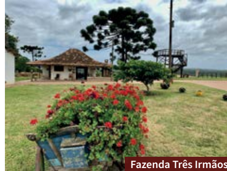
Fazenda Três Irmãos