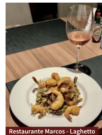
Restaurante Marcos - Laghetto