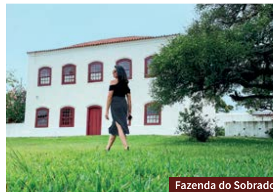
Fazenda do Sobrado

> Hotel das Figueiras: Com vista privilegiada para a Praia das Nereidas, tem área com piscina e ampla sala de café da manhã, com televisão e espaço para tomar chimarrão. Informações e reservas aqui