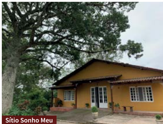
Sítio Sonho Meu

No local, não é permitido fumar nem levar bebidas alcoólicas, e o almoço é vegetariano. O espaço conta com trilha, cachoeira, área de piquenique e área coberta para descanso. ($) A visita ocorre sextas e sábados, das 9h até o pôr do sol. O valor da entrada por pessoa é de R$ 20.