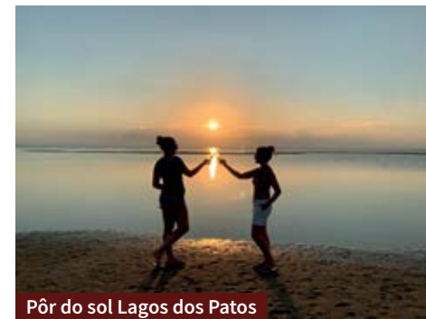
Pôr do sol Lagoa dos Patos