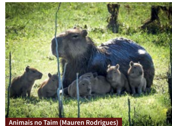
Animais no Taim (Mauren Rodrigues)