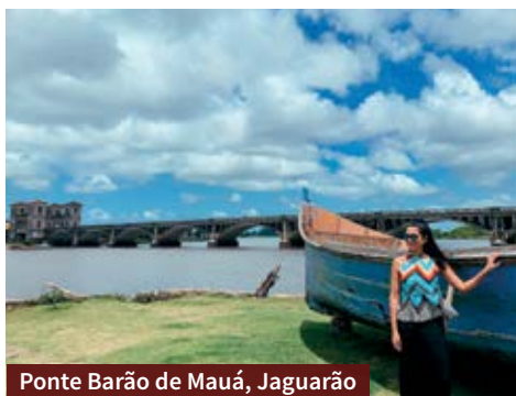
Ponte Barão de Mauá, Jaguarão