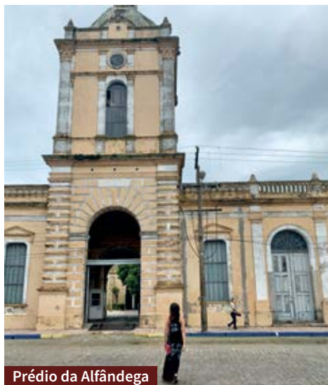
Prédio da Alfândega

No passeio vale conhecer também o museu que fica no prédio da alfândega e possui uma coleção histórica que conta mais sobre a cidade. Também aproveite para conhecer o Museu Náutico, que recebe hoje pequenas embarcações.