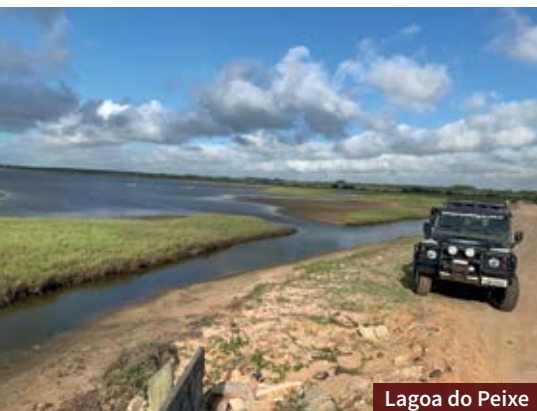
Lagoa do Peixe