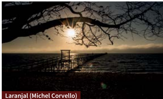
Laranjal (Michel Corvello)

A 15 minutos de carro do Centro, a Praia do Laranjal é local de refúgio de pelotenses e turistas. A praia de água doce tem calçadão e trapiche, com bela vista para a Lagoa dos Patos.