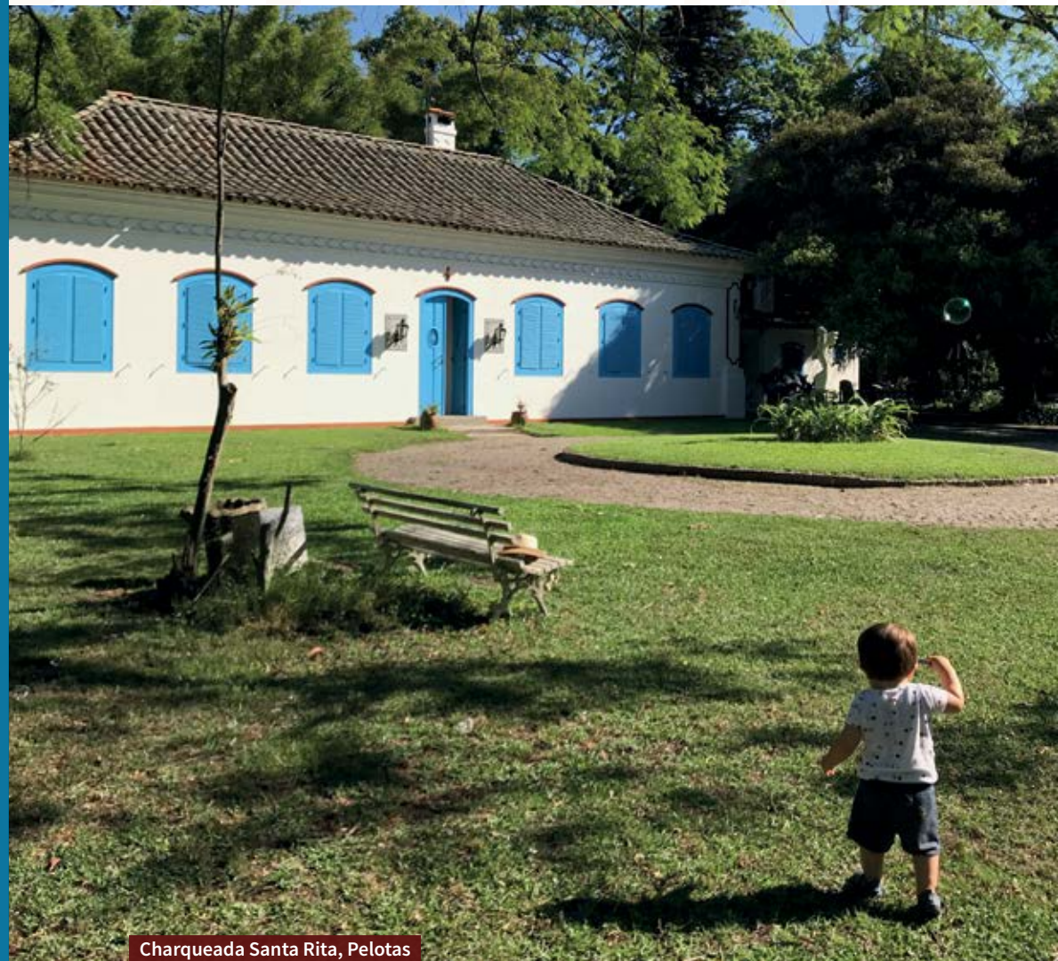
Charqueada Santa Rita, Pelotas