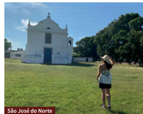
São José do Norte