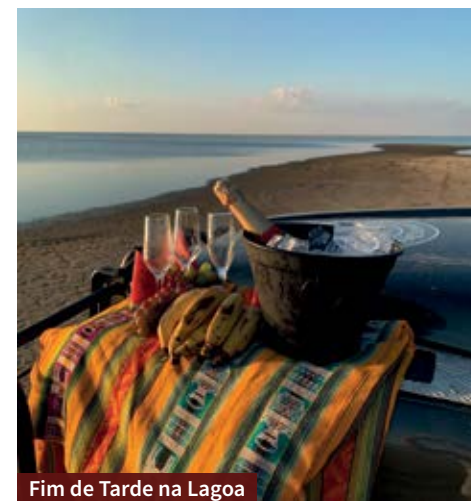
Fim de Tarde na Lagoa