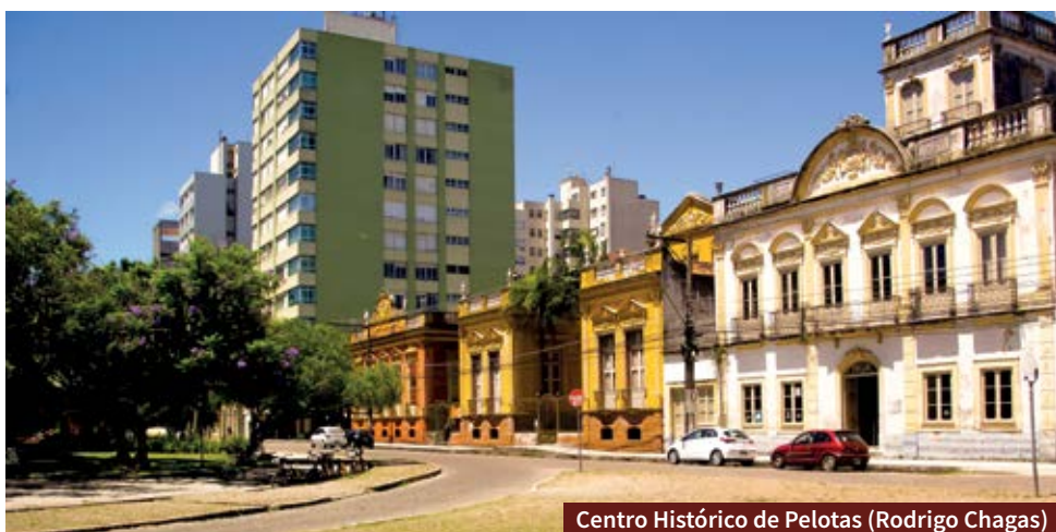
Centro Histórico de Pelotas

Informações: Eco 360° ecoturismo e aventura. Telefone: (51) 99595-9626. Veja também o Instagram e Facebook