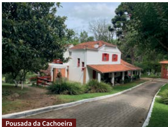
Pousada da Cachoeira