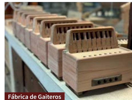
Fábrica de Gaiteros

A distância entre Porto Alegre e Barra do Ribeiro é de cerca de 1 hora percorrida de carro. Para quem vai da Capital, é preciso pegar a rodovia BR-116 em direção a Guaíba. Você pode combinar duas cidades neste roteiro!