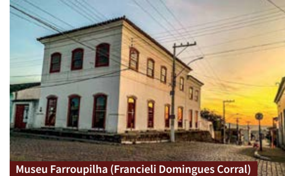
Museu Farroupilha (Francieli Domingues Corral)

diferentes pastéis, pizzas e opções de salgados. Ao meio-dia há buffet a quilo. Fica na Av. Gomes Jardim, 241.