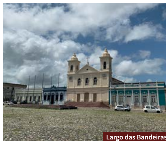
Largo das Bandeiras

Construída entre 1880 e 1883 com o objetivo de atender os oficiais e praças do exército, a antiga Enfermaria Militar fica no Cerro da Pólvora, ponto mais elevado da cidade. O prédio será restaurado e ali será instalado o Centro de Interpretação do Pampa, espécie de museu e complexo cultural ligado à Universidade Federal do Pampa.