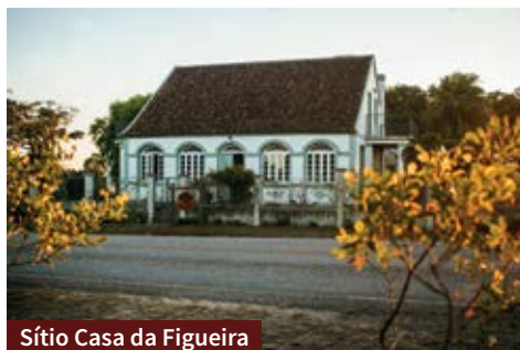
Sítio Casa da Figueira

Com fácil acesso, sem estradas de chão, o sítio dispõe de jardim, trilhas, áreas de contemplação e o mais lindo pôr do sol da região!