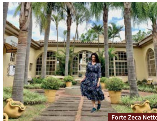
Forte Zeca Netto

> Decorado com objetos antigos, o restaurante La Campaia tem buffet a quilo e livre no almoço, com opções típicas gaúchas e diferentes tipos de carne. Nas quartas, quintas e sextas tem tele de sushi. Fica na Rua Marechal Floriano, 1116.