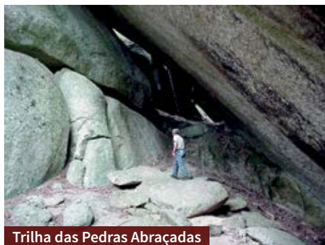
Trilha das Pedras Abraçadas

A aventura começa no pé do morro e segue sempre para cima. No percurso há uma sequência de rochas abraçadas por figueiras seculares.