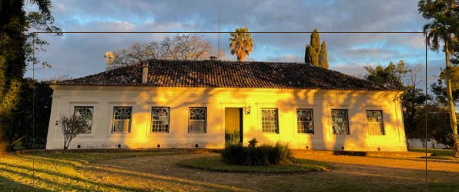
Pousada do Sobrado