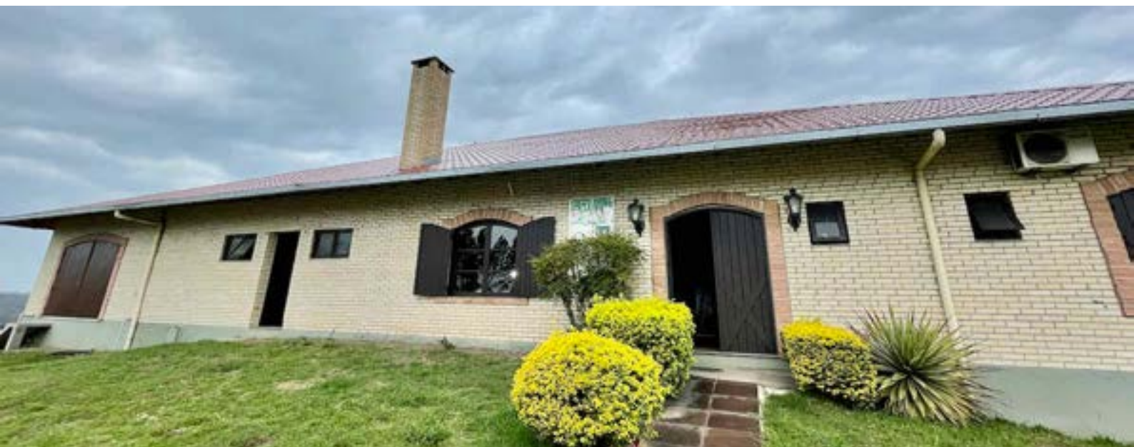
Cordilheira de Sant'Ana

VINÍCOLA PUEBLO PAMPEIRO – Fica na Vila Pampeiro, a cerca de uma hora e meia de Santana do Livramento e tem uma pegada mais off-road . Isso significa que você