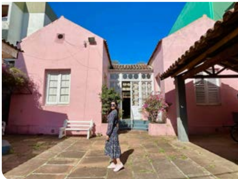
Museu Oswaldo Aranha

- Construída nos anos 1930, recebeu passageiros da linha Porto Alegre-Uruguaiana até 1996. Hoje fechada, mantém um antigo vagão na frente do prédio. Ao lado da estação está o Centro de Pesquisa e Documentação de Alegrete (Cepal), com arquivos e objetos históricos, exposições de paleontologia, arqueologia e gemologia. Fica na Rua Coronel Luiz Ignácio Jacques, 66, no Centro. Entrada gratuita. Atende de segunda a sábado, das 9h às 18h.