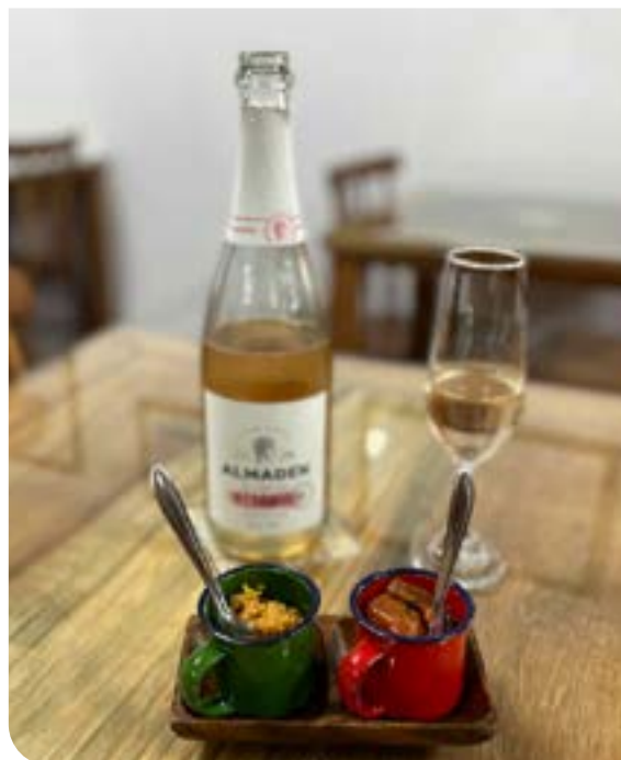
Restaurante A Bruxa