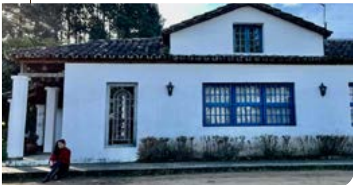
Osteria Santa Tecla