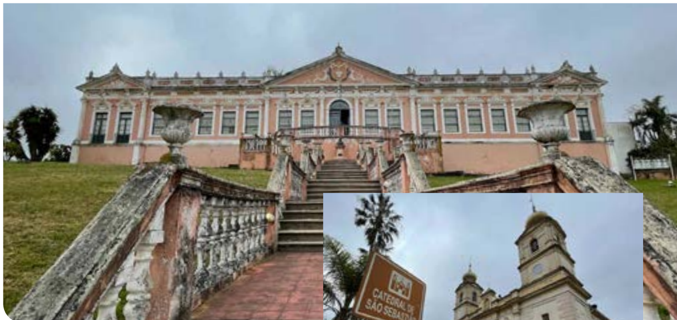
Museu Dom Diogo de Souza